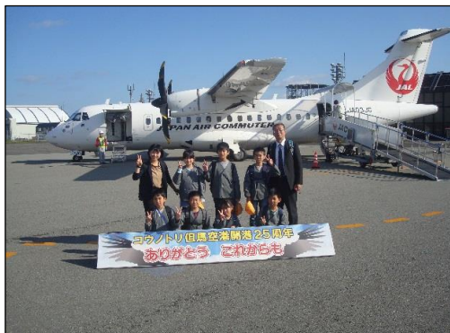
但馬空港で集合写真