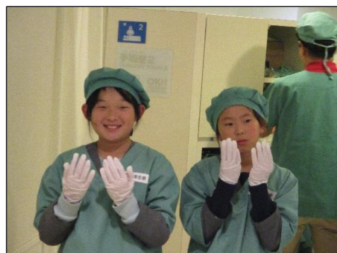
いろんな職業体験をしました