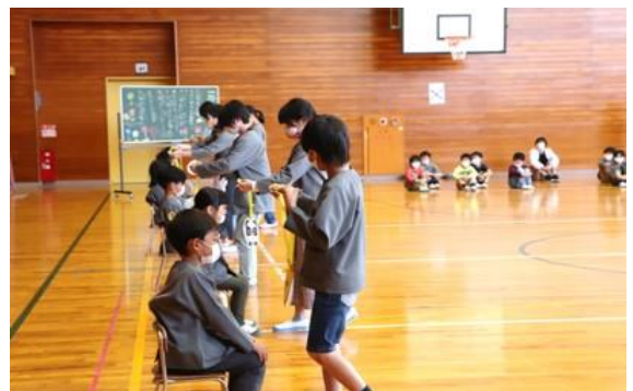
<6年生から1年生へメダルの贈呈>