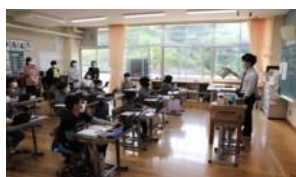
(各学年の授業参観)